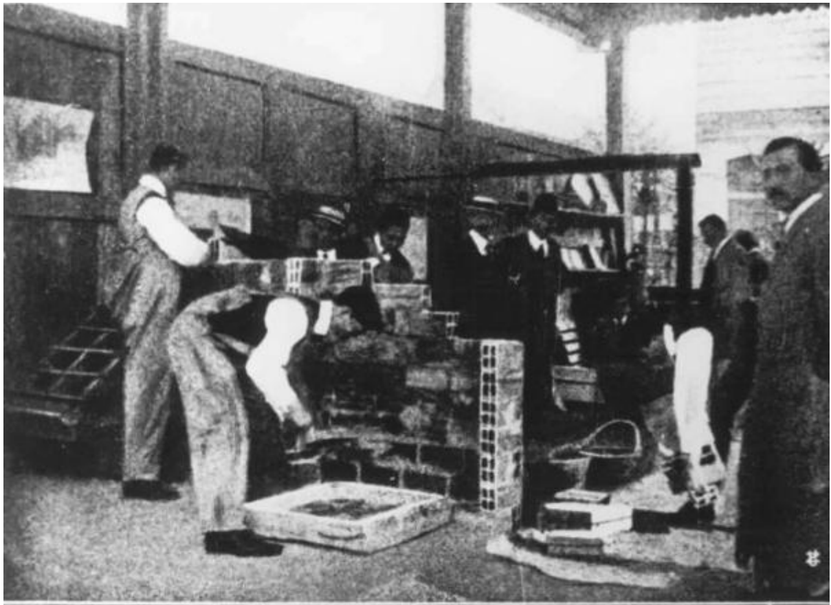
Campo di esercitazioni pratiche