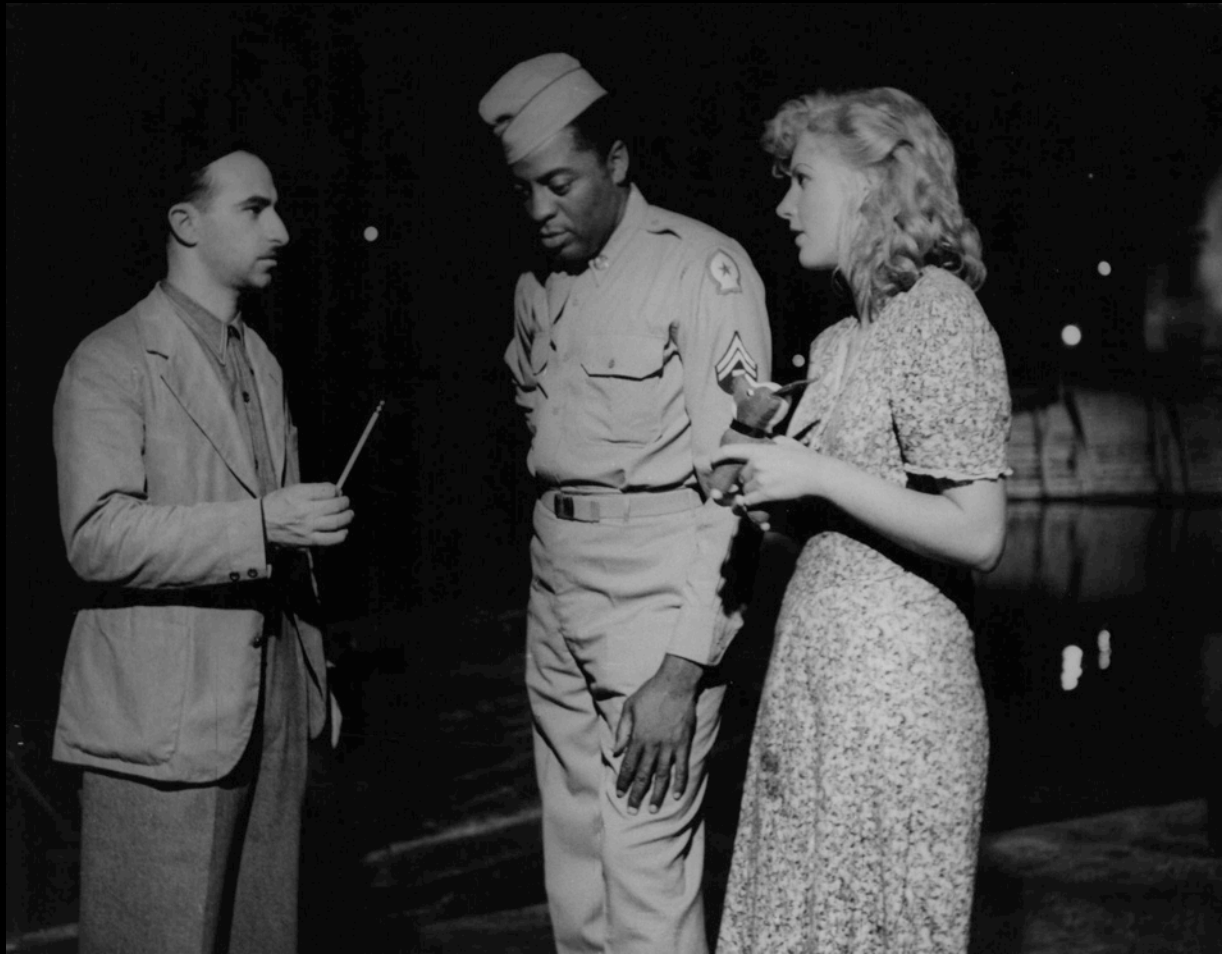
Set del film "Senza pietà" - Regia Alberto Lattuada - 1948 - Il regista Alberto Lattuada e gli attori John Kitzmiller e Carla Del Poggio