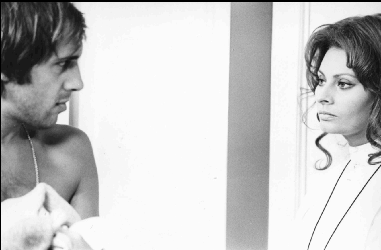
Set del film "Bianco, rosso e..." - Regia Alberto Lattuada - 1972 - Gli attori Sophia Loren e Adriano Celentano (fiction / scena di genere)