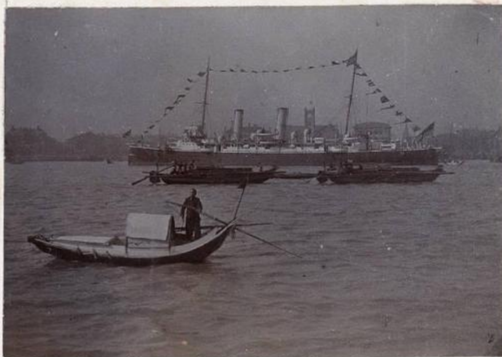
H.M.S. "BONAVENTURE" e suo Sampan