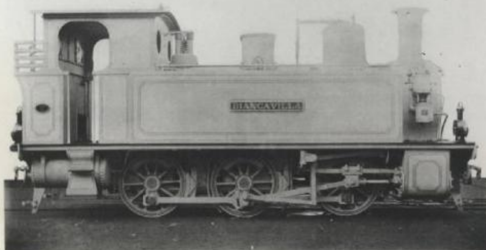
LOCOMOTIVA TENDER PER FERROVIE ECONOMICHE